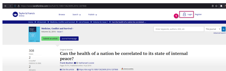
Figure 1 : Log in Taylor & Francis

Sélectionner Access through your institution