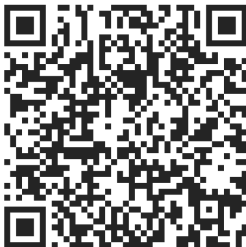
Figure 5 : QRcode de l'URL précédente

De manière générale, vous trouverez les informations utiles pour l'accès aux ressources documentaires de la Bibliothèque depuis les HUG à l'adresse suivante : https://www.unige.ch/biblio/fr/infos/sites/cmu/information-membres-hug/acces .