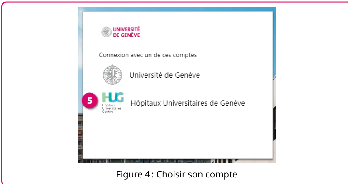
Figure 4: Choisir son compte

Sélectionner votre compte UNIGE (ISIs) ou HUG (SESAME)